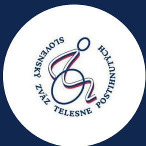
Slovenský zväz telesne postihnutých