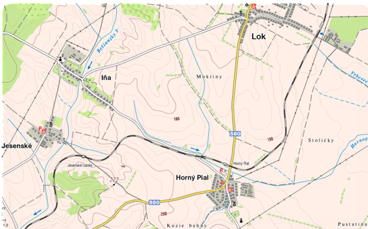
Lokalizácia obce v rámci okresu